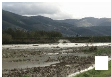
I CAMPI ALLAGATI A TREVÌ